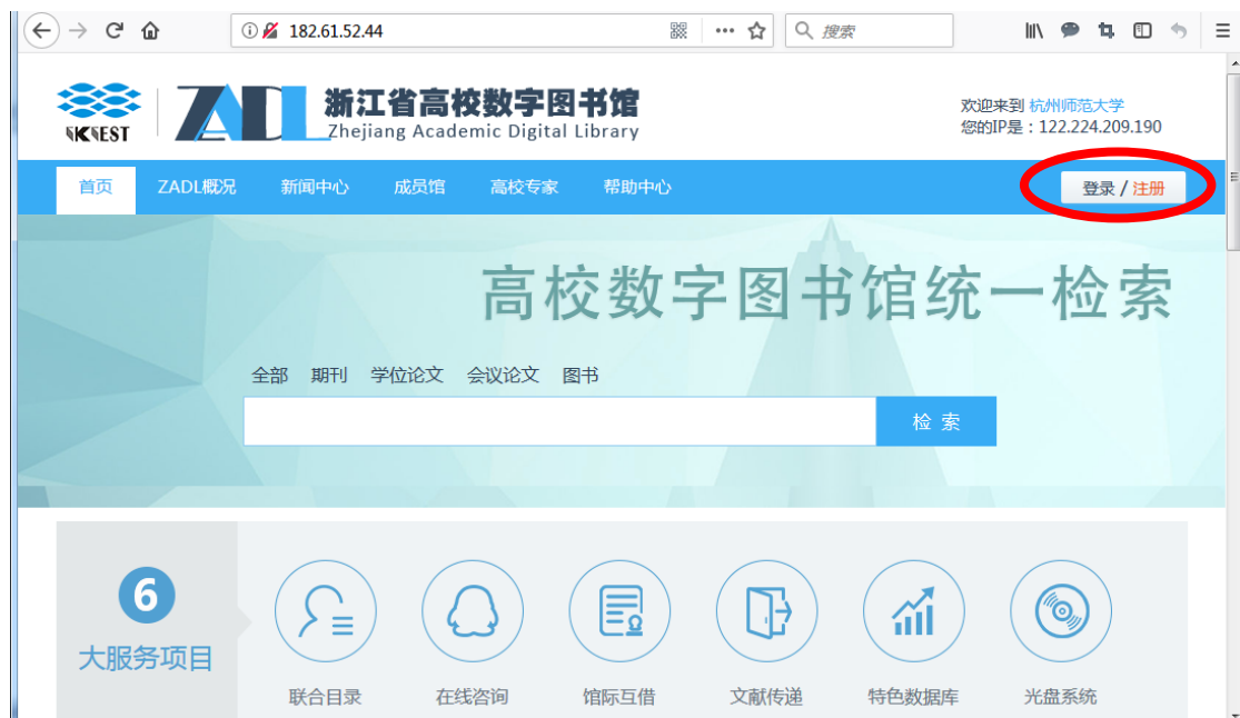
图 2 ZADL 浙江省高校升级我高校数字资源图书馆 网址： http://182.61.52.44