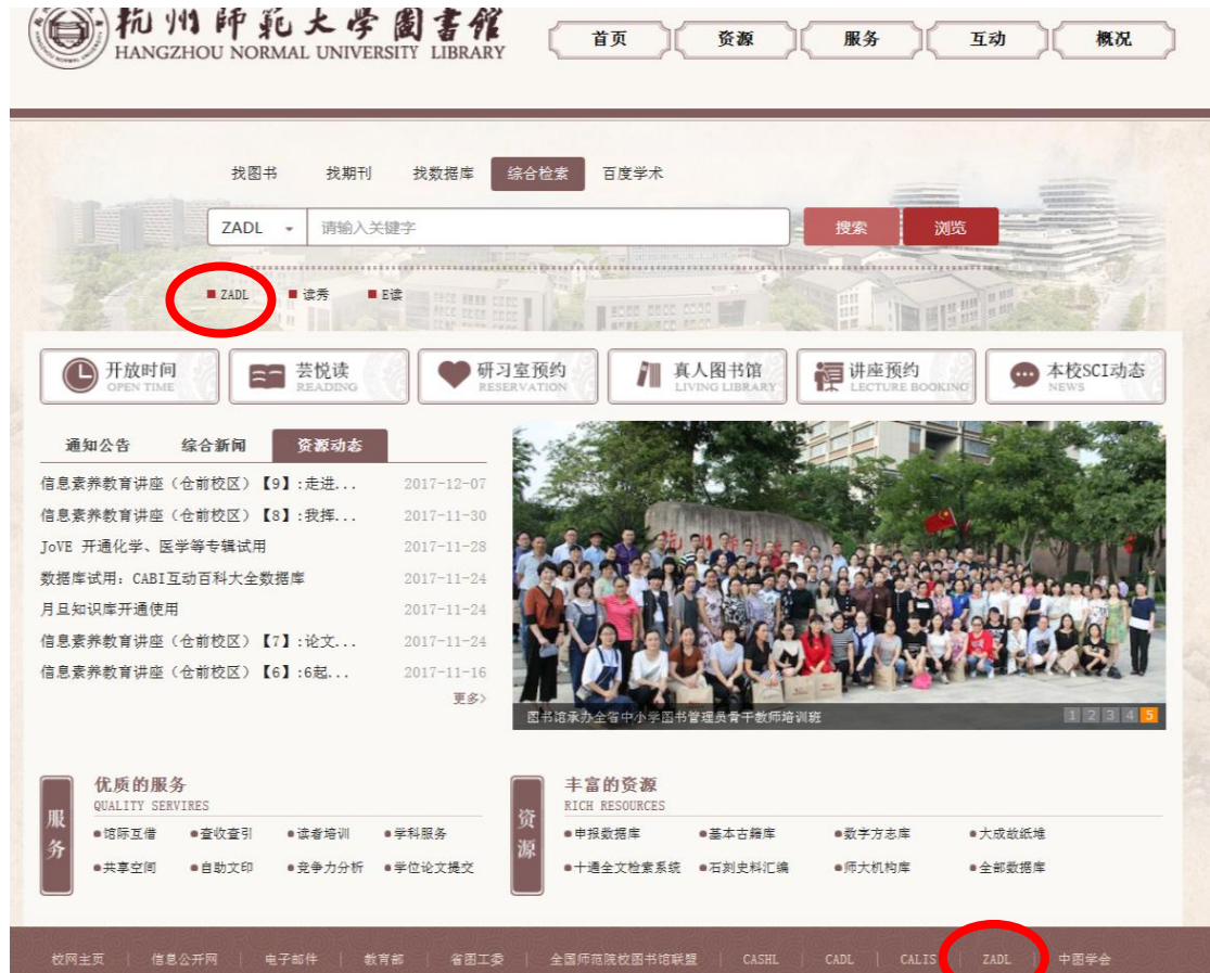
图 1 图书馆主页

Step1. 进入系统 图书馆主页 → 点击“ZADL”进入浙江省高校数字图书馆首页，点击“注册”进入下一步