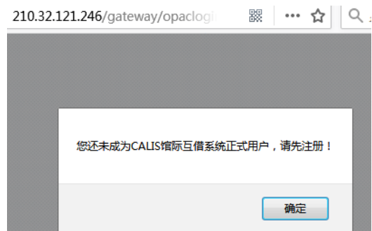
图 5 CALIS 馆际互借注册提示框

出现提示框点击“确定”（图 5）→ 进入杭州师范大学馆际互借读者网关系统（图 6）→ 按提示填写（缀有“*”的为必填项）→ 点击“提交” → 出现注册成功提示点击返回