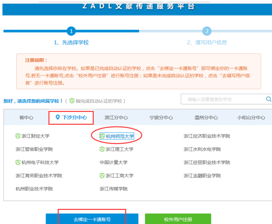
图3 绑定一卡通账号页面

Step2. 登录系统 进入 ZDDL 文献传递服务平台 → 请选择“下沙分中心”、“杭州师范大学” → 点击按钮“去绑定一卡通账号按钮” → 进入我校数字校园统一身份认证页面 → 输入账号登录进入下一步